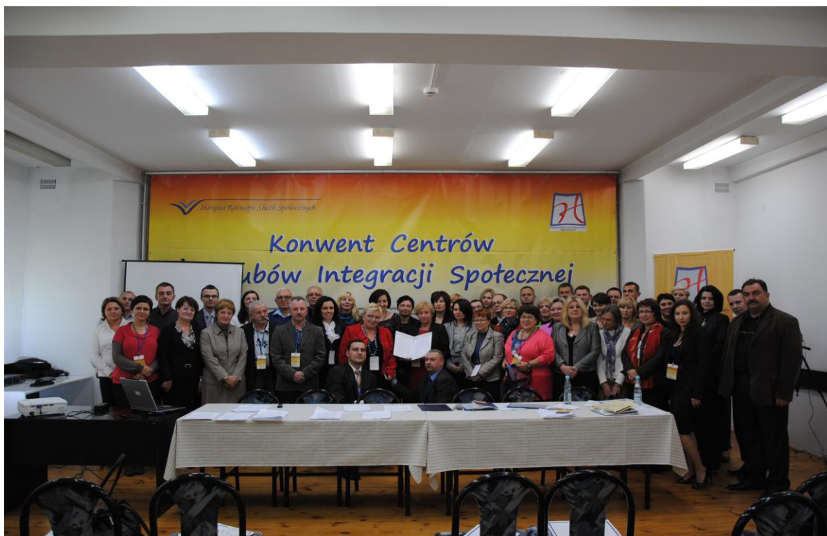
Foto 1. Podpisanie deklaracji powołania Konwentu CIS/KIS w dniu 14 października 2011 r.

Założycielami Konwentu CIS/KIS zostało 19 podmiotów, reprezentujących centra integracji społecznej oraz 23 jednostki organizacyjne, reprezentujące kluby integracji społecznej. Na dzień 31 maja 2012 r. grono członków Konwentu CIS/KIS powiększyło się do liczby 78 podmiotów zatrudnienia socjalnego, z tego: 39 centrów integracji społecznej i 39 klubów integracji społecznej. Konwent CIS/KIS wybrał Radę Programową, przyjmując zasadę demokratycznej równości podmiotów zatrudnienia socjalnego, czyli po dwóch reprezentantów ze środowiska centrów integracji społecznej i ze środowiska klubów integracji społecznej. Zgodnie z wolą członków założycieli Konwentu, a także z przyjętą regulaminową zasadą w skład Rady Programowej wchodzi osoba wskazana przez Departament Pomocy i Integracji Społecznej. Funkcje Sekretariatu Konwentu CIS/KIS powierzono Instytutowi Rozwoju Służb Społecznych w Warszawie a zadania dla tej rady, określone w Regulaminie Konwentu obejmują m.in. następujący zakres zadań: przygotowanie propozycji merytorycznego planu pracy na kolejny rok funkcjonowania Konwentu, podejmowanie decyzji o przystąpieniu do Konwentu nowych członków, którzy zgłoszą chęć przystąpienia, reprezentowanie członków Konwentu w spotkaniach z przedstawicielami instytucji administracji rządowej, samorządowej, przedsiębiorcami oraz parlamentarzystami, a także przedstawianie stanowisk Konwentu na forum publicznym oraz przygotowywanie i wydawanie komunikatów i informacji o pracach Konwentu.