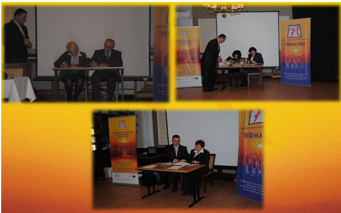
Foto 2. Moment podpisania deklaracji powołującej Lubelskie Partnerstwo Klubów Integracji Społecznej – 23 listopada 2011 r..